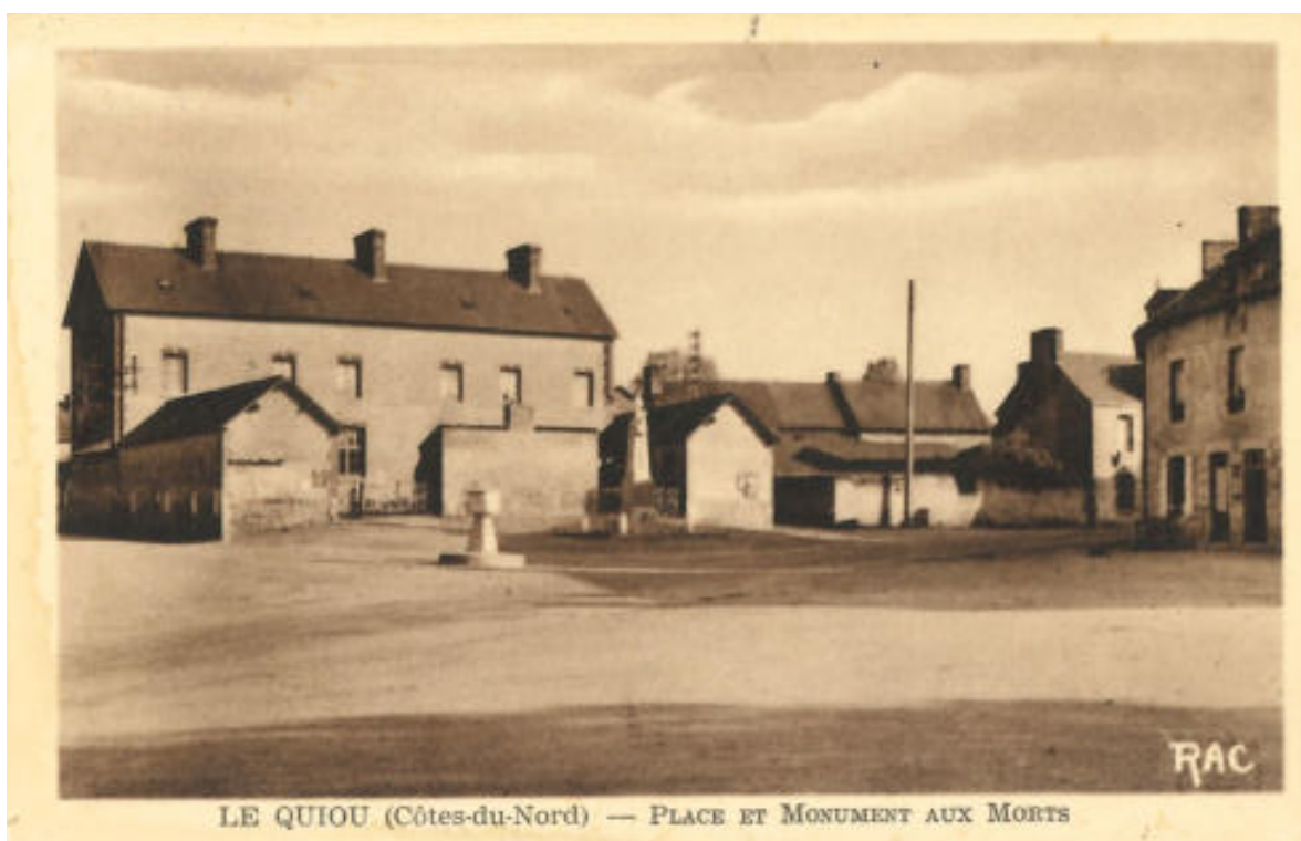
LE QUIOU (Côtes-du-Nord) — PLACE ET MONUMENT AUX MORTS