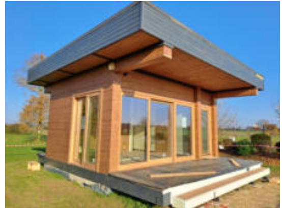
Chalet de présentation